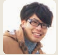
公務員として活躍

社会人として通学していましたが、国籍や年齢を超えて様々な立場の人たちと学ぶことができ、刺激的な毎日でした。修了後は環境の専門職として働いていますが、研究科で身につけた幅広い視野と深い専門性は仕事でも生かされており、北海道の環境や道民のために貢献していきたいと思っています。