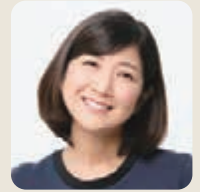
気象予報士として活躍

気候変動による暑熱環境の変化が与える人間健康への影響を都市樹木の生態系サービスがどれだけ緩和できるのか経済評価する研究をしておりました。国境を超えた仲間達と様々な価値観や情報を共有し、研究に没頭出来た2年間はかけがえのないものになりました。この研究を生かし自分の番組の中で情報発信していこうと思っています。