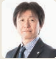
自然保護団体で活躍

多様な価値観や文化的慣習の利害が内在する環境問題にはトレードオフが発生し、解決には科学的知見やポリシーミックスに加え、国家横断的アプローチが必要です。研究科では各分野の内外専門家によるゼミやシンポジウムに加え、各国留学生との交流や議論を通じ真のグローバルズムを体験し、獲得した知見や人脈は環境保全活動の重要な財産となりました。